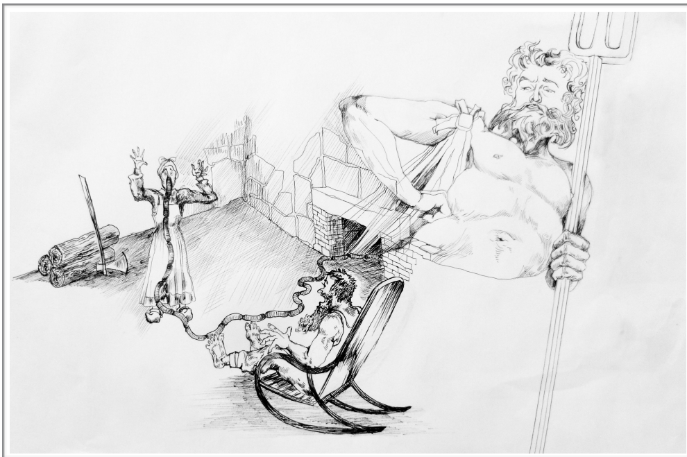
Les Souhairs Ridicules

Pendant une heure et quart, quatre comédiens - dont une marionnettiste spécialisée - au visage découvert ou masqué, manipulent objets et marionnettes, dansent, chantent et mènent le jeu !